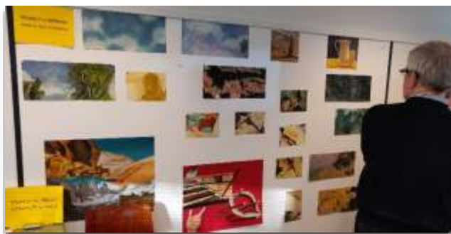
De expositie ART VU op 9 december 2018.